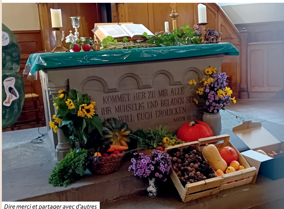
Dire merci et partager avec d'autres